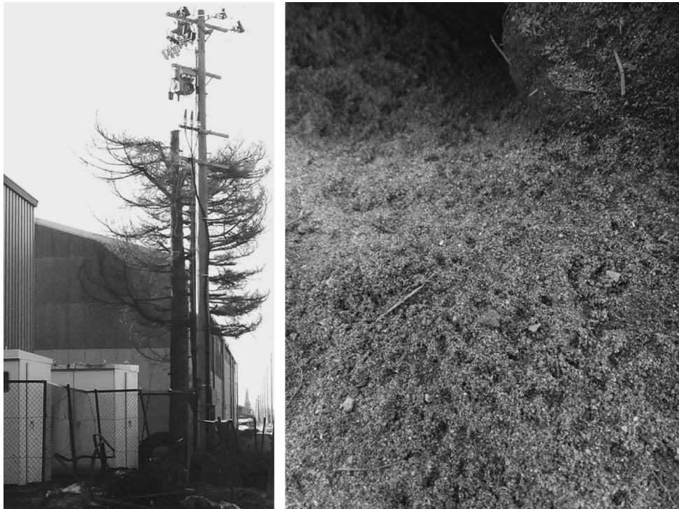
Fig. 2. Rat hole with fresh footprints under trees besides a rice storehouse at a port in Ishinomaki. See locality b in Fig. 1.