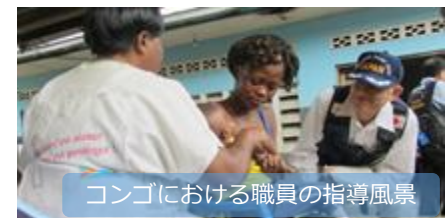
コンゴにおける職員の指導風景