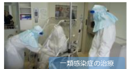
一類感染症の治療