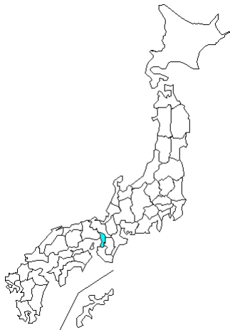
1 例 EV71 合計