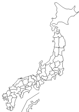
報告なし Enterovirus 71