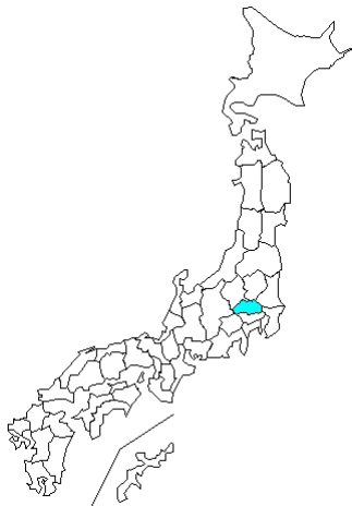
1 例 その他・不明