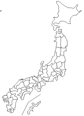
報告なし 気管支喘息