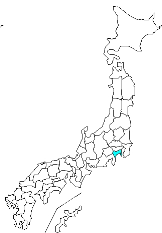
1 例 その他不明