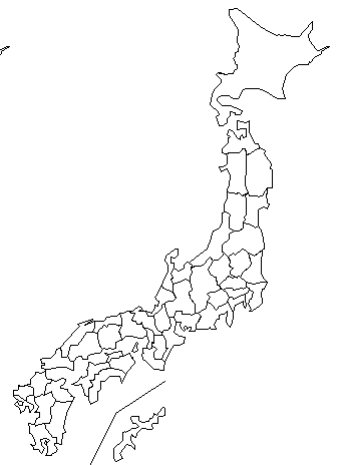
報告なし Hepatitis A virus IIB